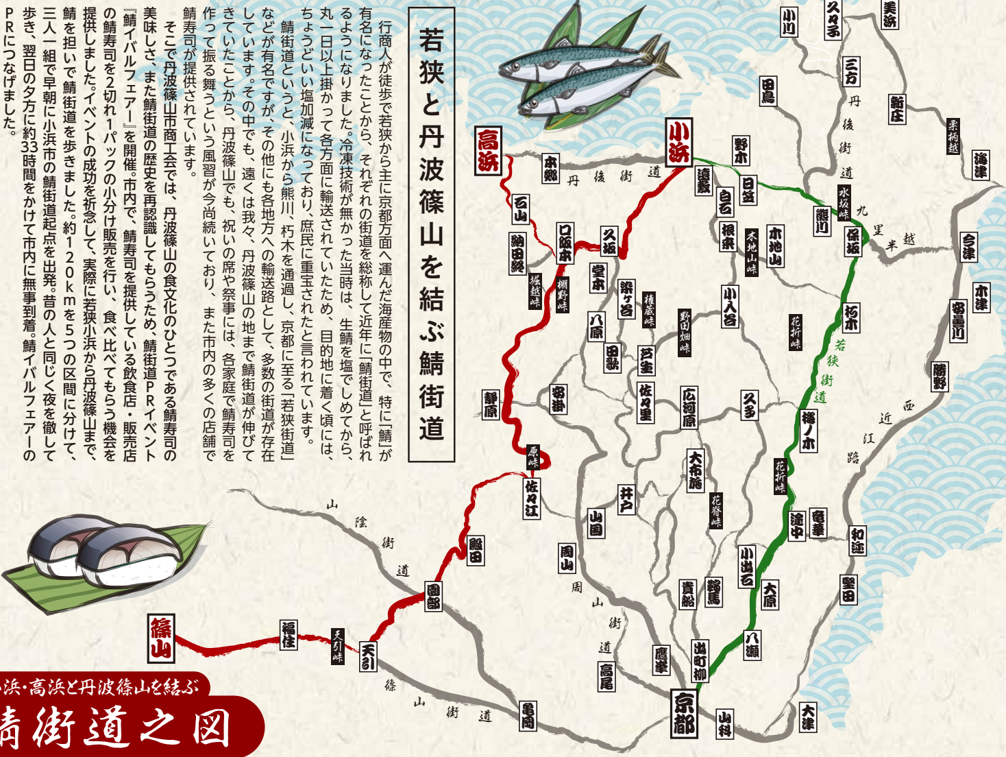
小浜・高浜と丹波篠山を結ぶ鯖街道之図